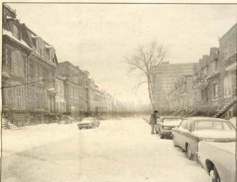
Some Things Never Change: A snowfall brought both beauty and a bit of extra work to a resident of Sainte-Famille Street. (Photo taken January 17, 1972.)

The pictures on this page were all taken by David Miller, a professional photographer. Many thanks to David for generously giving his time and work.