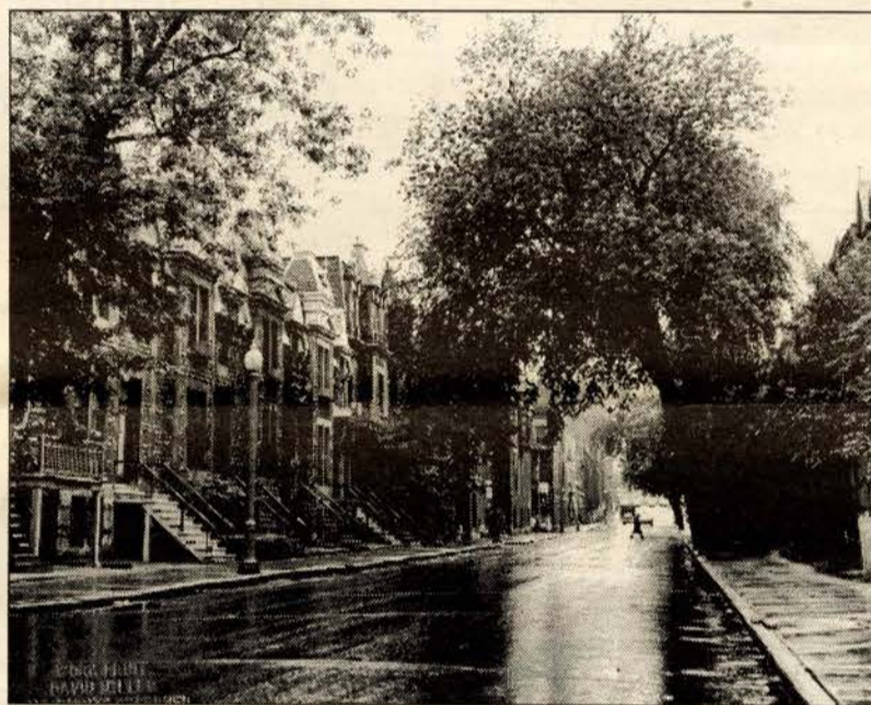
A tree arching over Hutchison Street helped create a light and shadow show on July 14, 1971.

Plus ça change... Une tempête de neige a apporté de la beauté et du travail à un résident de la rue Sainte-Famille. (Photo prise le 17 janvier 1972.)