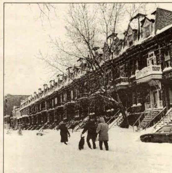
The snow couldn't deter people from getting outside to walk along Jeanne-Mance Street on February 20, 1972.

Vue vers le nord sur l'avenue du Parc. Reconnaissez-vous des commerces ou des bâtiments? (Photo prise le 2 juin 1971.)