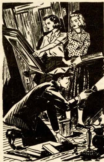
"Loot!" he announced. "There must be more of it here!" The Clue of the Rusty Key

Do you know of any other incidents? The Milton-Parc Citizen's Committee is preparing regular reports on crime and incidents of harassment in the neighbourhood. Let them know — their reports will be published in Place publique Milton-Parc . By calling 844-6029 and leaving a message, you too can help keep your neighbourhood safe through active community participation. ♦