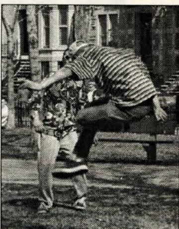
Les adeptes du aki sont de retour dans les parcs. The aki pros are back in the parks.