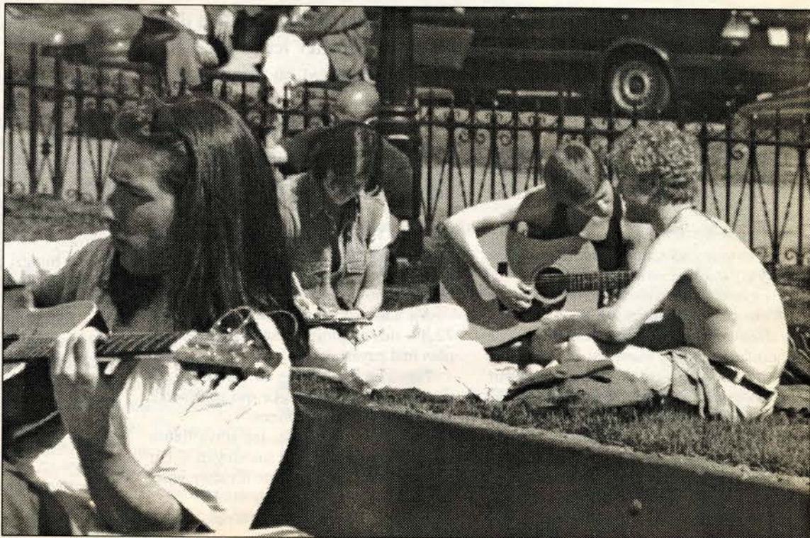
Pour un instant, j'ai oublié l'hiver... Hey! For a minute I almost forgot about winter...