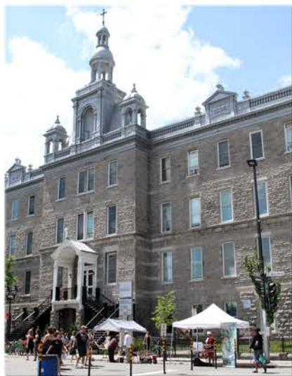
La bibliothèque et la Maison de la Culture du Plateau, là où s'est tenue la première réunion de la Société d'histoire du Plateau en 2005.

CETTE tribune est parfaite pour rendre hommage à mes collègues qui ont démontré une motivation constante dans cette aventure. Au risque d'en oublier quelques-uns, voici quelques bons coups de la Société d'histoire depuis 10 ans. Pour plus de détails de ces bons coups, je vous invite à lire les rapports des différents responsables dans le présent numéro.