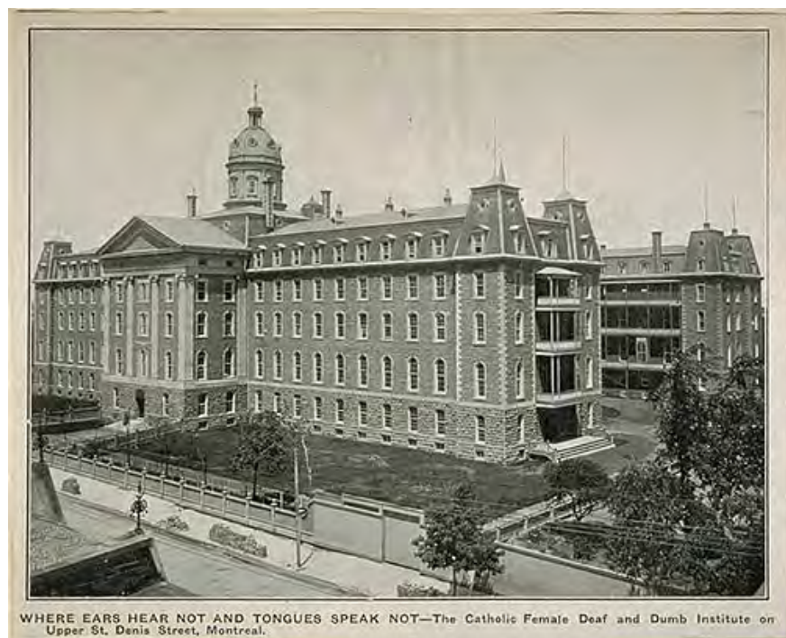
WHERE EARS HEAR NOT AND TONGUES SPEAK NOT—The Catholic Female Deaf and Dumb Institute on Upper St. Denis Street, Montreal.

architecturaux. La construction du bâtiment marque alors le coup d'envoi de l'essor urbain vers le nord, avec le prolongement de la rue Saint-Denis et le lotissement de nombreux terrains. L'Institution prend rapidement de l'expansion. Deux ailes sont ajoutées en 1873 puis en 1877.