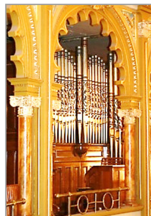
L'orgue de chœur

LA CHAPELLE Saint-Louis, qui est dédiée surtout aux mariages, possède un instrument de neuf jeux, également du facteur Casa-