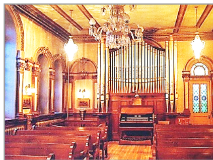
L'orgue de la chapelle Saint-Louis

LA RESTAURATION a donc eu essentiellement pour but de doter cet instrument de véritables prin-