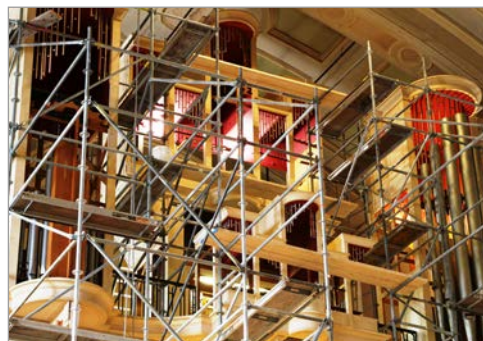
Les buffets vidés.

POURQUOI la nécessité d'une restauration ? À ma première visite, je fus impressionné de voir les buffets vides – cette structure de menuiserie dans laquelle sont placés les sommiers et les tuyaux – et les tuyaux cordés le long du mur. Monsieur Côté me présenta plusieurs de ces derniers, qui justifiaient sa présence : certains étaient abimés par des accords successifs et d'autres avaient tout simplement l'orifice du pied affaibli par l'effet de la gravité au fil des 57 ans d'existence. D'autres éléments mécaniques seront également révisés : les frictions dans le mécanisme seront enlevées et tout sera réajusté. En plus de réparer les tuyaux et de les accorder, le facteur Juget-Sinclair va redresser les sommiers et remplacer le cuir des soufflets. De plus, avant de tout remettre en place, il va peindre les buffets de l'orgue. Il est convenu que le design