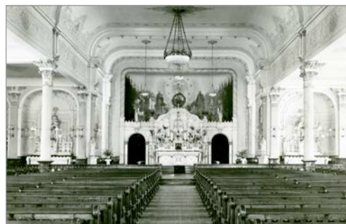
L'intérieur de la chapelle du Sacré-Cœur.

EN 1895 , la construction de l'église actuelle débute. Dans l'entente, les Jésuites avaient obtenu la permission de construire à l'arrière de l'église un scolasticat. La première église, commencée en 1875 et terminée en 1887, devint la chapelle du Sacré-Cœur. Le scolasticat et la chapelle seront plus tard démolis pour permettre la