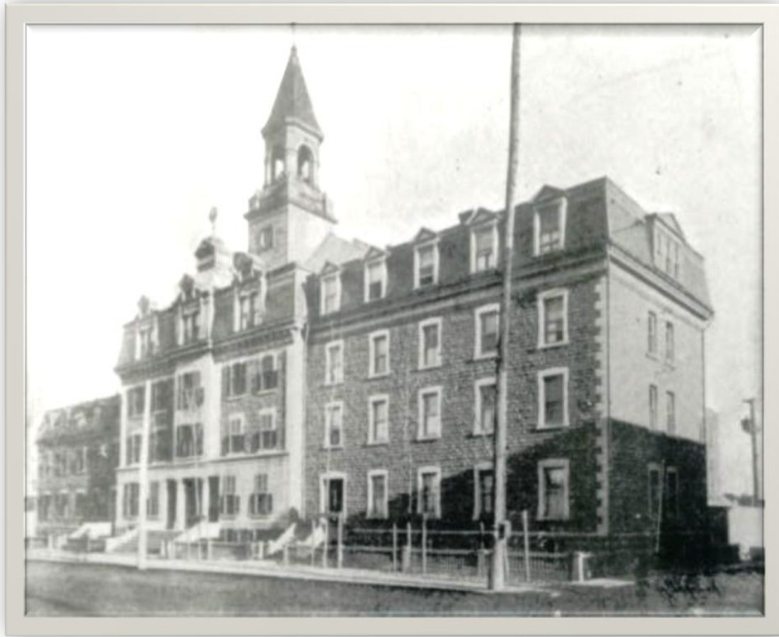
L'église des Pères du Très-Saint-Sacrement, avenue du Mont-Royal, en 1898.