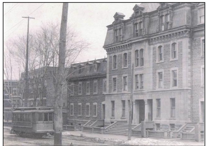
Imprimerie (1904), Maison Barré, église (1892), noviciat (1896).

1923 : Les supérieurs ont toujours rêvé d'ériger un grand temple à la gloire du Seigneur dans l'Eucharistie. Dès 1923, on préparait le terrain. Le 26 décembre, une convention était signée entre La Congrégation et Monsieur Ernest Cormier, architecte et ingénieur, pour l'élaboration de plans et devis pour la construction d'une église et d'un monastère. De cette époque on ne conserve qu'un plan terrier de Cormier pour une église qui englobe le sanctuaire de 1892.