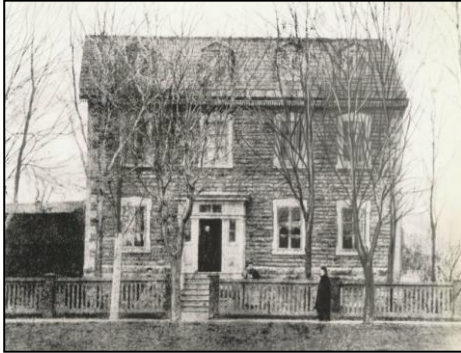
◀ La Maison Barré en 1892.