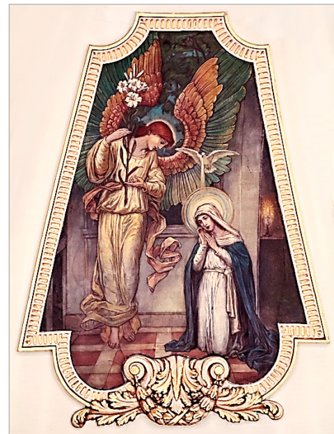
L'Annonciation par Ozias Leduc