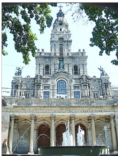
« Le Retour des anges » sur la façade de Saint-Enfant-Jésus Photo de K. Cohalan, le 13 juin 2015

bâtitteur de Mgr Ignace Bourget, elle a subi depuis 160 ans de nombreuses transformations, mais certains de ses éléments d'origine, surtout les murs latéraux, se trouvent toujours présents dans l'édifice tel que l'on connaît aujourd'hui.