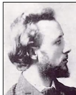
Ozias Leduc (1864-1955) vers 40 ans