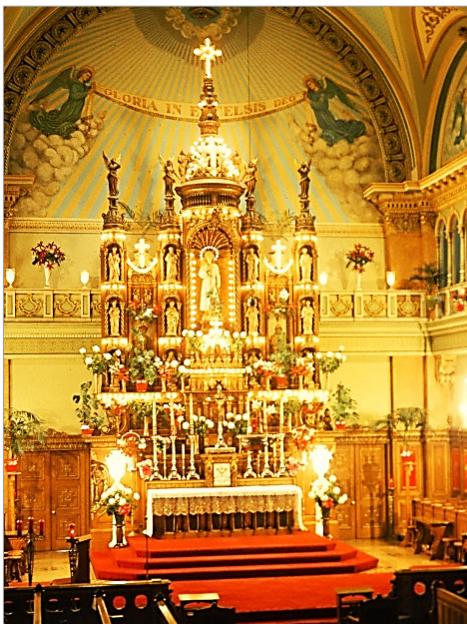
Le maître-autel vers 1960

Photothèque de La Presse, reproduite dans Montréal : son histoire, son architecture par Guy Pinard, tome 5, Méridien, 1992